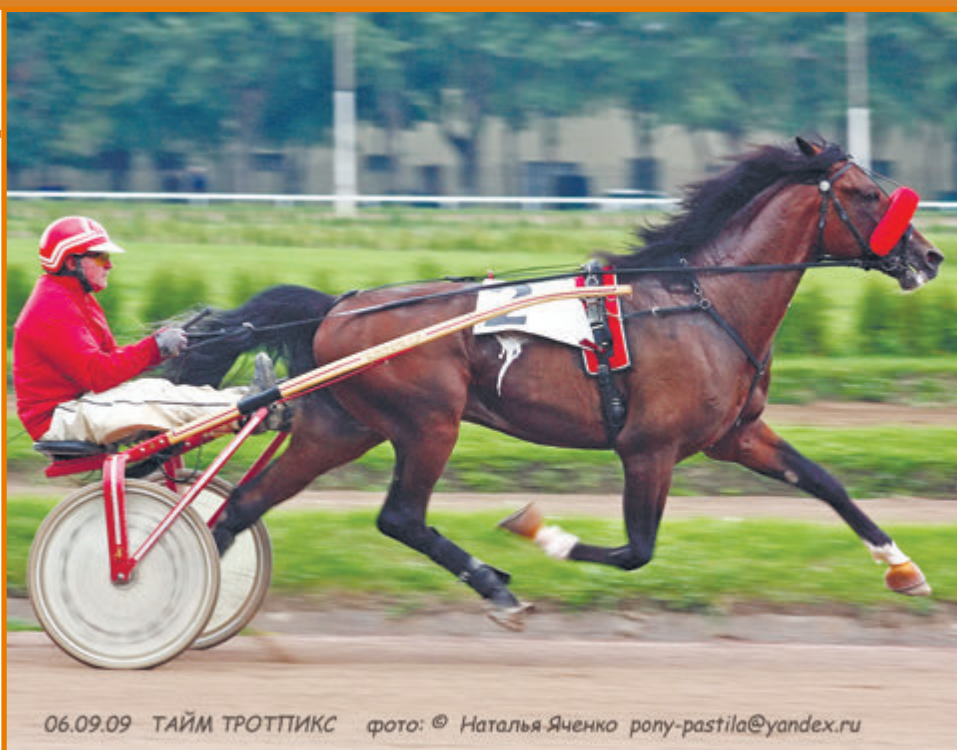
06.09.09 ТАЙМ ТРОТТИКС