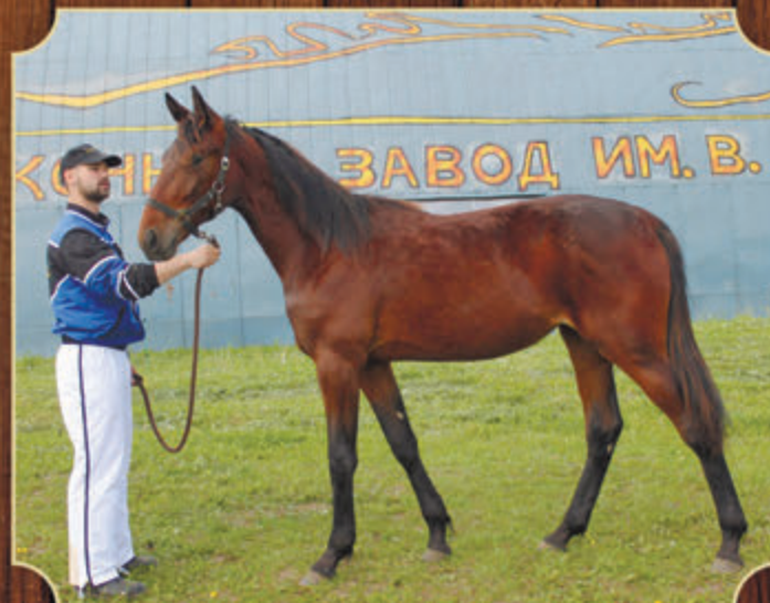
Резкость РМ (к) (Classic Photo - Регалия) 2016 г.р.