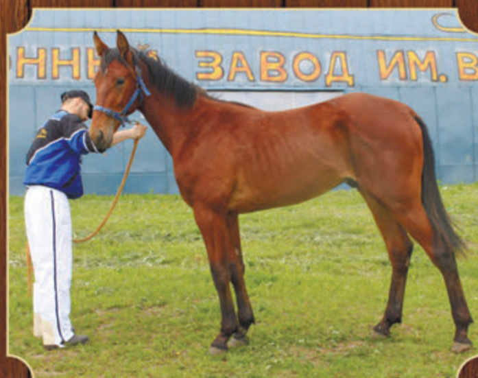
Зов Предков РМ (ж) (Weingartner - Затишь) 2016 г.р.

Возможно дорращивание в заводе - 5 000 руб./мес. Телефон.: +7 962-321-07-67