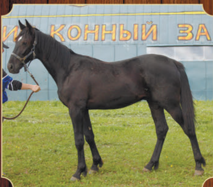
Активный РМ (ж) (Classic Photo - Активизация) 2016 г.р.