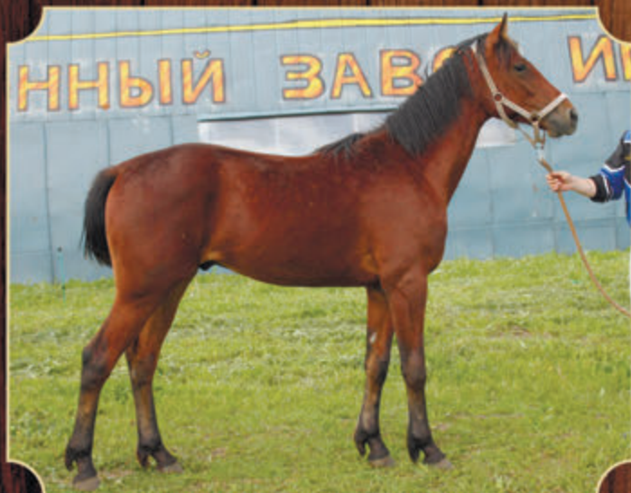
Платный РМ (ж) (Nuke It Freddie - Пандора) 2016 г.р.