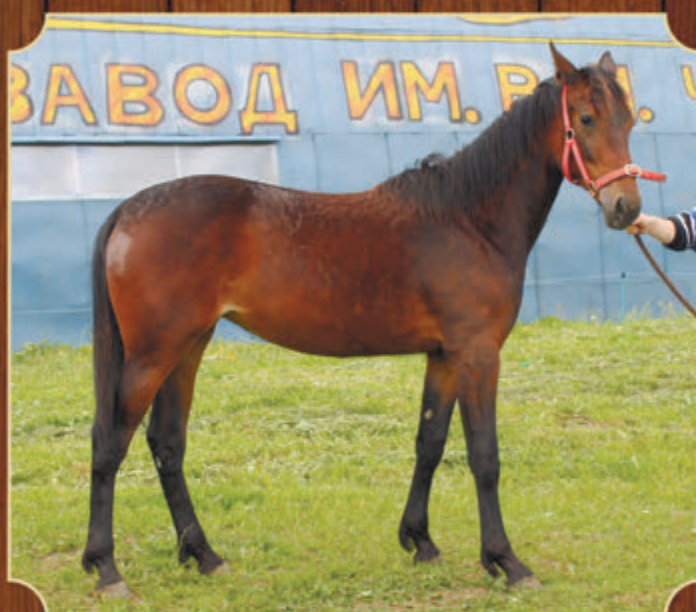
А Зори Здесь Тихие РМ (к) (Pine Chip - Аза) 2016 г.р.