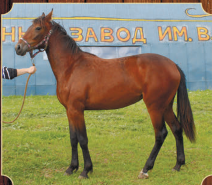
Остановить Нельзя РМ (к) (Pine Chip - Облава) 2016 г.р.