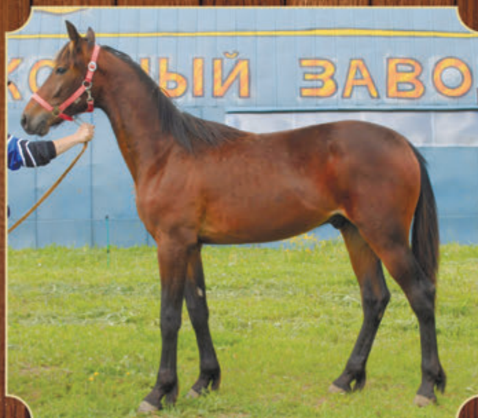
Гриффиндор РМ (ж) (Classic Photo - Глориоза) 2016 г.р.