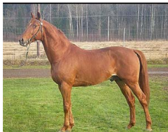
Look de Star