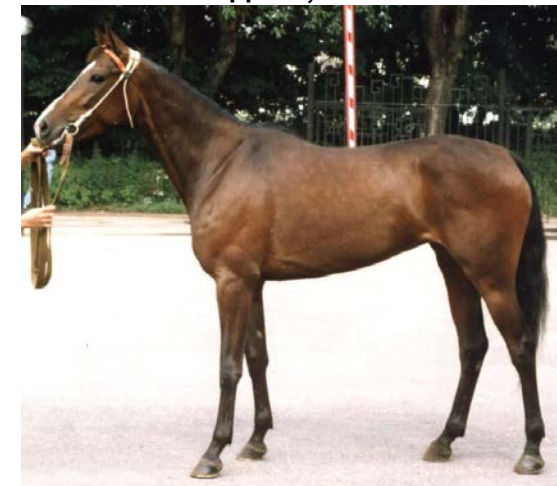
Пасадена, 1997 г.