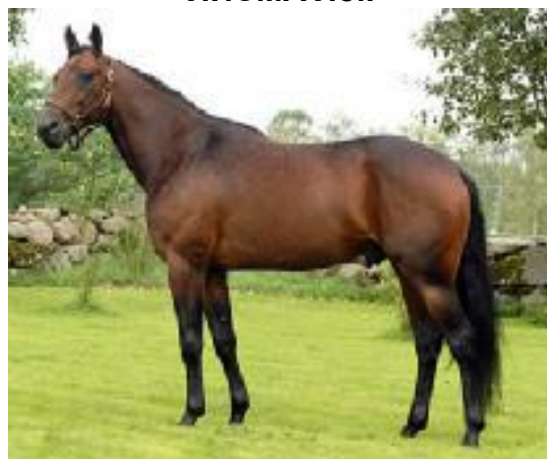
Mr. Pine Chip