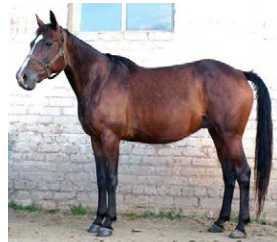
Пасадена, 2006 г.