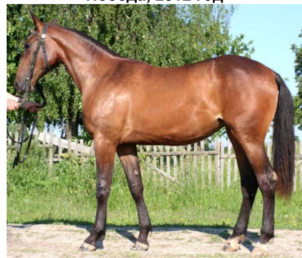
Победа, 2006 год