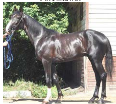
Грааль Лок 2.00 (Реал Лидер-Гонимая)