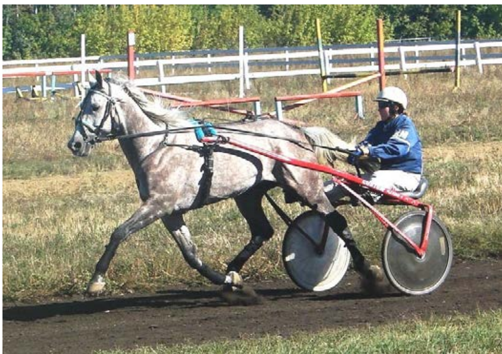
Владыка (К.Матвеева), Чесменский кз, 2010 г.