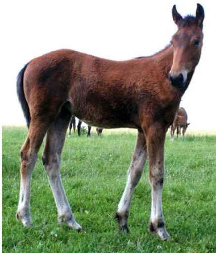
Лирика Любви, 2006 г.