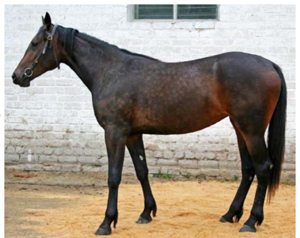
Графология Лок, фото 2008 г.