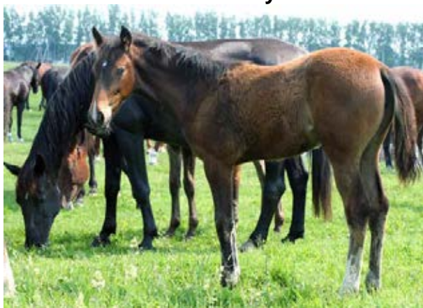
Поэзия Любви, 2006 год