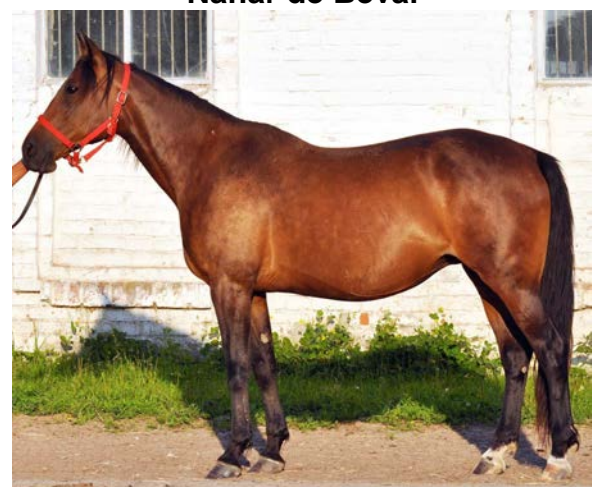
Победа, 2012 год