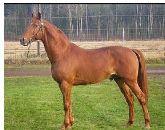
Look de Star