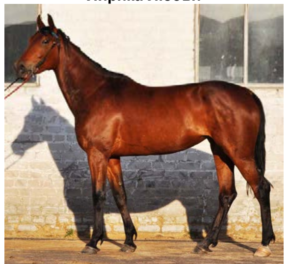
Лирика Любви, 2011 г.