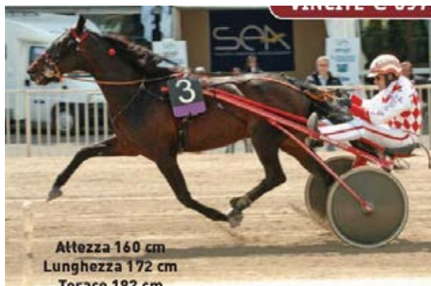
Altezza 160 cm Lunghezza 172 cm Torace 192 cm

Беговая карьера: Сумма выигрыша 908.812$