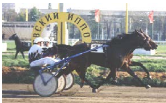
Фабий, Верба, ЦМИ, 2004 г