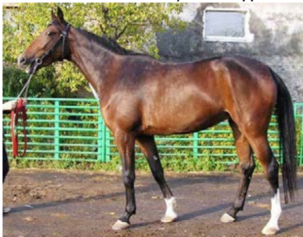
Поэзия Любви, 2009 год