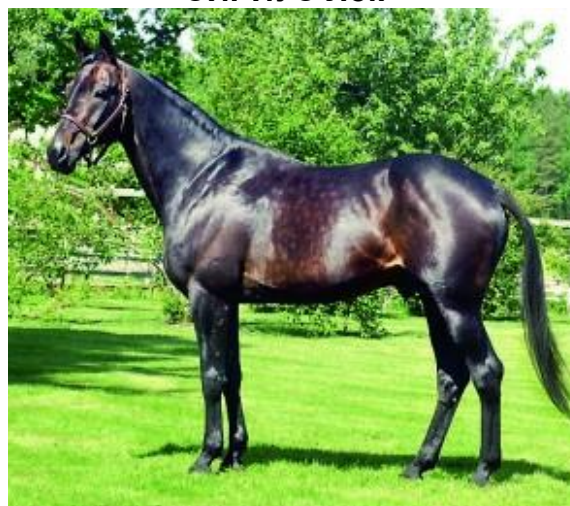
Rite on Line

МММ: Li Lady 1.17,6 г.к. 73 (Limit (Тангейзер-Лимфа) – элитная матка Швеции. Выступала 139=16-19-14, дала 15 жеребят ( в т.ч. 7-1.15)