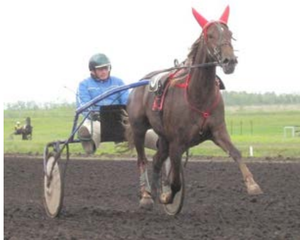
Мисс Лав Лок