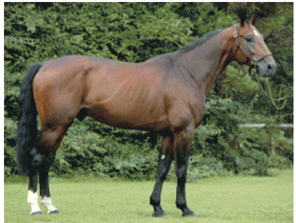
Nahar de Bewal

Семейство Весняной Годыны, из которого вышли Версаль 1.58; Верба 2.01,2; Винсен 2.01,7 и др.