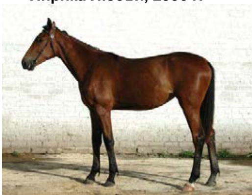
Лирика Любви, 2007 г.