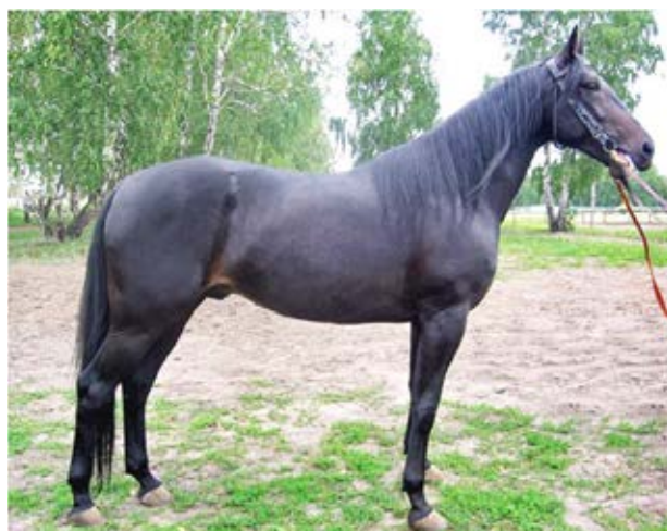
Forman Blue Chip

| Гибкая 2.10 (2-х лет) г.к.2005 (Blue Laday)