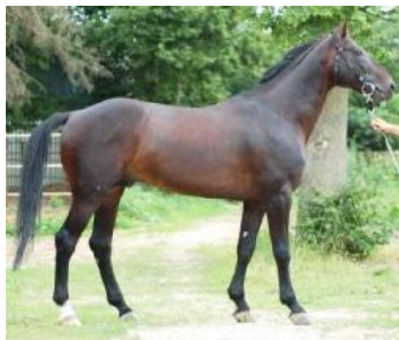
Окапи de Clerlande