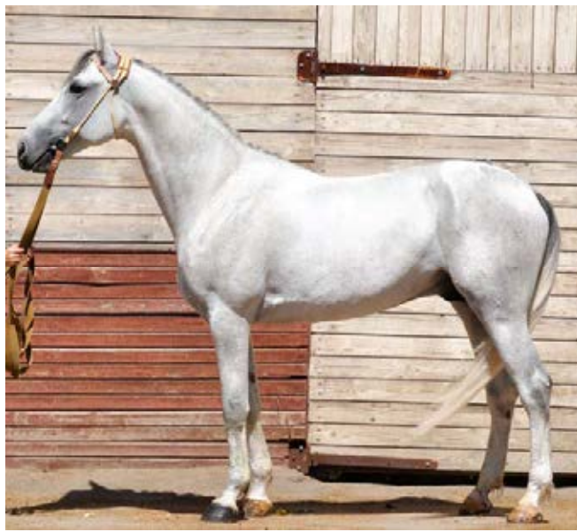
Приват Банк (Блю Ледей-Поморка)

Необходимо отметить, что среди локотских кобыл невысокий процент маток преклонного возраста. Это выдающиеся кобылы: Афродита, Поморка, Zoom исключительной ценности. Ежегодно в маточный состав поступают молодые кобылы высокого ипподромного класса. В исключительных ситуациях были зачислены небезавшие кобылы или с тихим рекордом выдающегося происхождения (дочери Love You, Pine Chip).