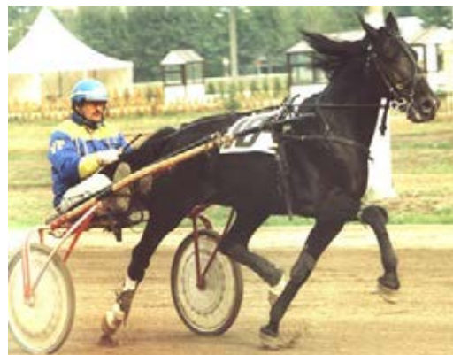
Фарат, 2002 г.

Натиск 2.00,9 г.ж.95 (Меридиан 2.00,7) – рекордист, производитель