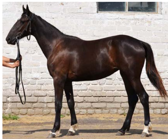
Spinning Back Kick

South Beach Toy н.б. г.к. 2004 (Dream Vacation)