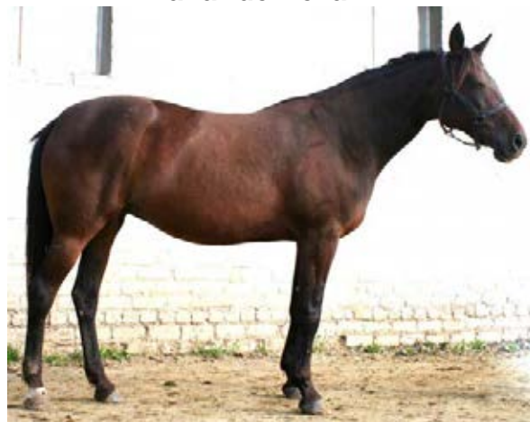
Посредница, 2006 год